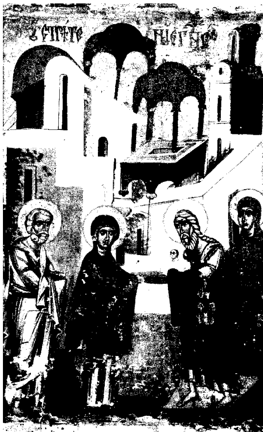
Představení v chrámu (Polsko – konec 15. stol.)

připravovali na křest, mohli být přítomni pouze