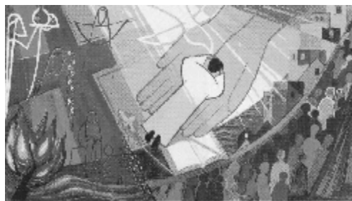
„Svěcení“ (opatství Turvey)

„Vezmi si, Pane, a přijmi celou moji svobodu, mou paměť, můj rozum a celou moji vůli, všechn můj majetek a moje vlastnictví. Tys mi to dal, Tobě, Pane, to vracím zpět. Všechno je Tvoje, nalož s tím zcela podle své vůle.